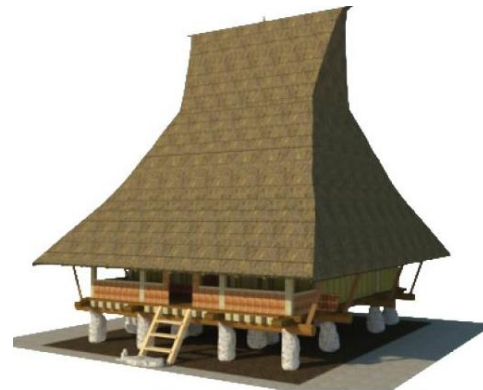
Gambar 1. Rumah adat di Desa Wologai

Rumah tradisional/ adat di Kabupaten Ende, pada umumnya merupakan rumah panggung dengan bentuk atap mengikuti filosofi bentuk perahu (Mochsen, 2003: 8). Gambar di bawah ini merupakan hasil penelitian mengenai rumah adat di Kabupaten Ende di dua desa yang berbeda.