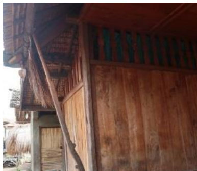
Gambar 5. Dinding Sa'o Sue Sumber : Dokumentasi Kerong, 2020