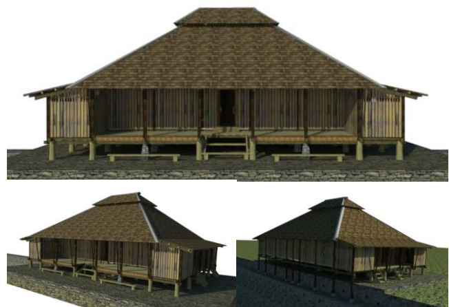
Gambar 8. Rumah adat Sa'o Sue

Perubahan bentuk atap yang terjadi pada rumah adat Sa'o Sue tidak serta merta menghilangkan ciri khas rumah tradisional secara keseluruhan, karena yang berubah hanya pada atap. Seperti yang dikatakan Rapoport dalam Nurjani bahwa Rumah merupakan manifestasi dari nilai sosial budaya masyarakat yang erat kaitannya dengan nilai sosial budaya penghuninya, yang dalam proses penyusunannya menggunakan dasar norma-norma tradisi (Rapoport dalam Nurjani, 2016; 201-202). Seluruh aktivitas keseharian maupun ritual adat tetap dilaksanakan seperti biasa walaupun terjadinya perubahan pada bentuk atap rumah adat Sa'o Sue .