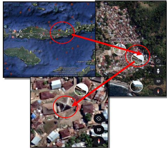
Gambar 3. (A) Lokasi Kabupaten Ende. (B) Desa Wolotopo, (C) Sa'o Sue

dari penelitian ini adalah Sa'o Sue dilihat dari bentuk atap yang berbeda dari rumah adat di Desa Wolotopo keseluruhan maupun secara umum di Kabupaten Ende. Dalam kesehariannya, Sa'o Sue berfungsi sebagai rumah tinggal yang di dalamnya terdapat 6 kepala keluarga.