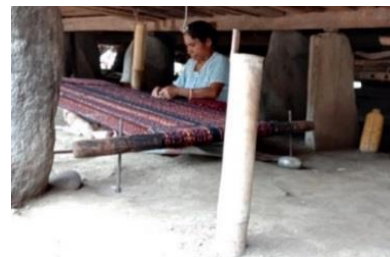
Gambar 7. Kolong Sa'o Sue

Sesuai dengan hasil wawancara, pada awalnya atap rumah adat Sa'o Sue ini sama seperti rumah adat pada umumnya di Kabupaten Ende. Namun sejalan dengan waktu, bentuk atap ini kemudian dibangun