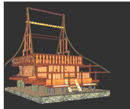
Gambar 2. Rumah adat Sa'o Ria di Desa Nuaone

Kedua bentuk rumah adat di atas memiliki bentuk atap yang menyerupai bentuk perahu sesuai dengan filosofinya berbeda dengan bentuk rumah adat yang ada di Desa Wolotopo. Setelah melakukan wawancara ditemukan bahwa atap rumah adat Sa'o Sue mengalami perubahan. Rapoport mengatakan bahwa terjadinya perubahan pada bentuk rumah pada umumnya dipengaruhi oleh perkembangan fungsi, teknologi konstruksi, material yang digunakan dan juga pengaruh alam. (Rapoport: 1969). Sedangkan Ching (2000) dan Habraken (1978) mengatakan perubahan bentuk bangunan dapat meliputi perubahan pada wujud (bentuk atap, dinding, lantai, struktur, bentuk pintu, jendela) dan warna. Perubahan yang terjadi pada rumah adat Sa'o Sue karena beberapa faktor yang mempengaruhinya.